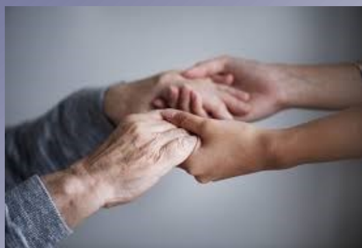
Guide du proche aidant

Son objectif est de mieux informer et conseiller tous les personnels placés dans cette situation sur leurs droits et les démarches à effectuer, en rassemblant dans un document unique de nombreux dispositifs souvent épars ainsi que leur permettre de les utiliser en les éclairant sur leurs incidences juridiques à la fois professionnelles et personnelles.