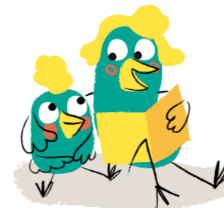
Illustration : © Mylène Rigaudie / Milan Presse 2020.