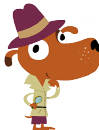
Illustration : © Hélène Convert, d'après un personnage créé par Nathalie Choux / Milan Presse 2020.

GEO ADO, tous les mois une fenêtre ouverte sur notre monde complexe et passionnant.