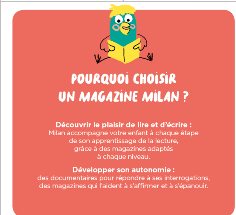
Illustration : Mylène Rigaudie