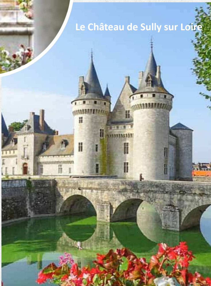
Le Château de Sully sur Loire