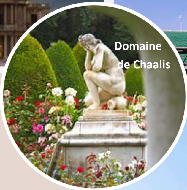
Domaine de Chaalis