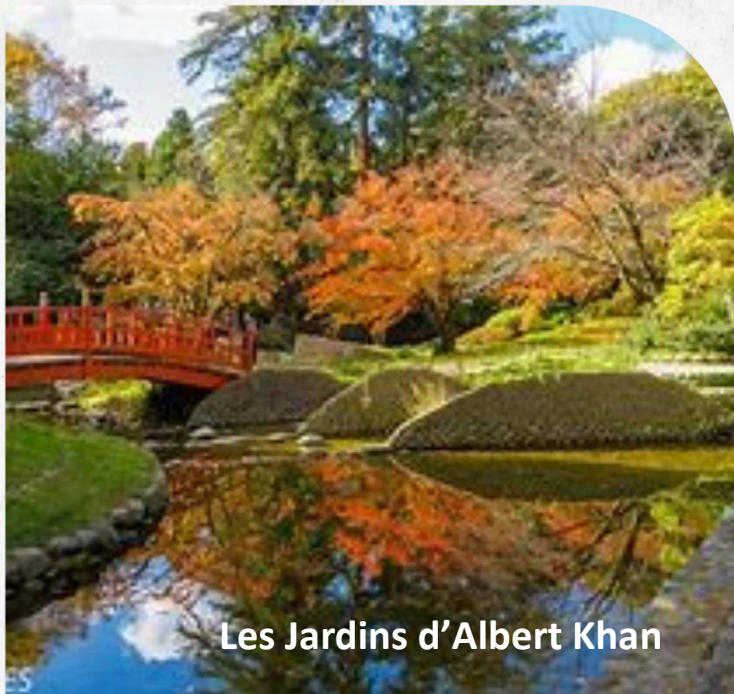
Les Jardins d'Albert Khan