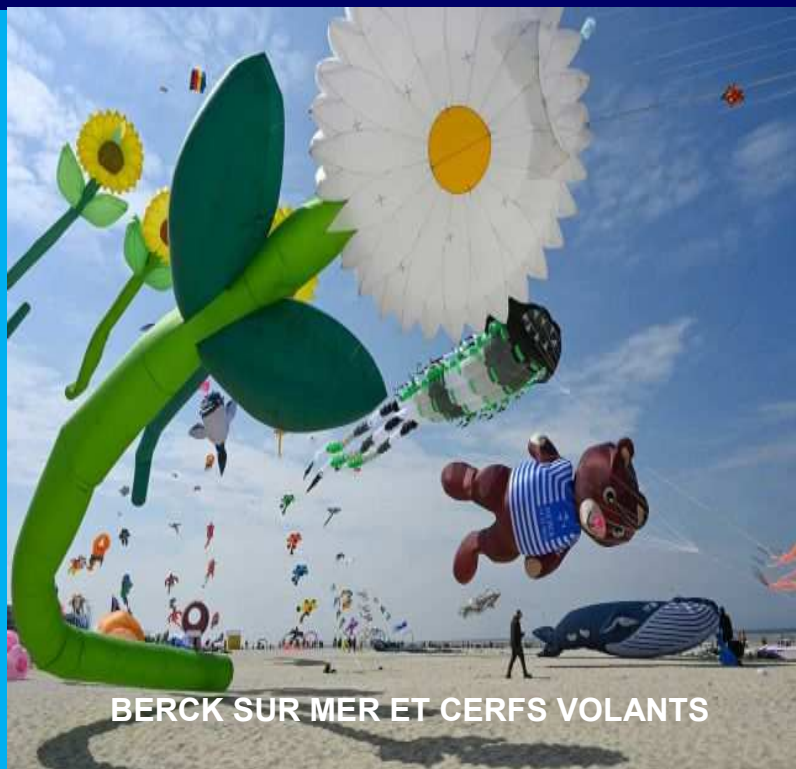
BERCK SUR MER ET CERFS VOLANTS

Spectacle de Danse ZEPHYR, (uniquement pour les actifs), samedi 15 juin