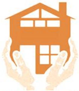
Dispositifs Hébergement temporaire d'urgence