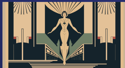
Image en mouvement, début du cinéma : aux origines du regard cinématographique, entre illusions visuelles et inventions qui ont préparé la naissance du cinéma. Inscription