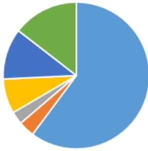
Répartition des crédits d'actions locales

■ Noël ■ Retraités ■ Amitiés Finances ■ Consultations ■ Abonnements ■ Sorties