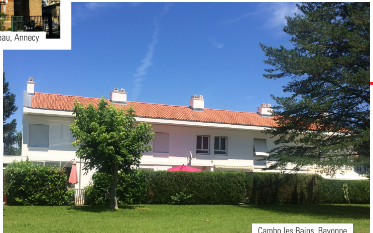
Cambo les Bains, Bayonne