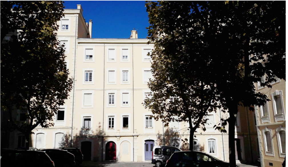
La Joliette, Marseille