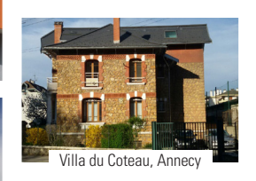
Villa du Coteau, Annecy