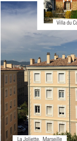
La Joliette, Marseille