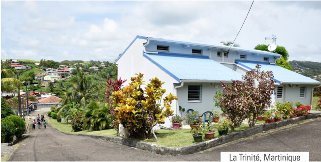
La Trinité, Martinique