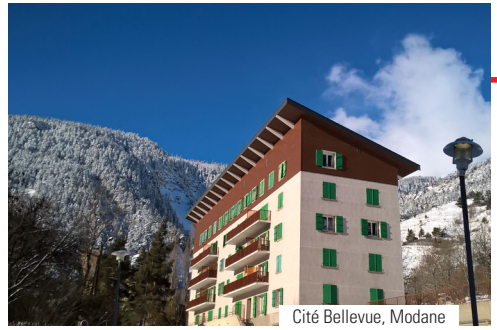
Cité Bellevue, Modane